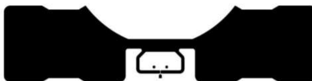
CHIP COM ESPUMA