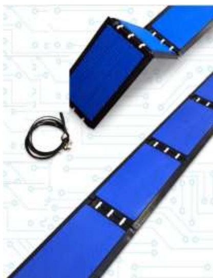
ANTENA DE PISO DOBRÁVEL